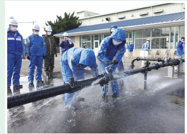
防災訓練（令和5年1月 広島県福山市）

福山市上下水道局で行われた防災訓練に参加しました。 （松江市は福山市・尾道市と相互応援協定を結んでいます。）