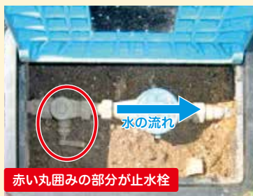
赤い丸囲みの部分が止水栓