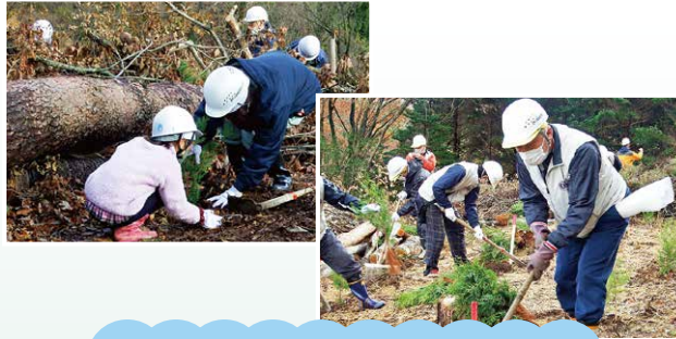
忌部水源の森づくり交流会植樹風景

毎年11月には、市民団体等の参加もいただき「忌部水源の森づくり交流会」を開催しています。