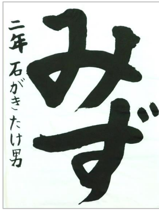
島根大学附属義務教育学校 2年