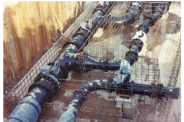
大庭配水池 (6,000 m 3 ) 満水位標高: 77.50m