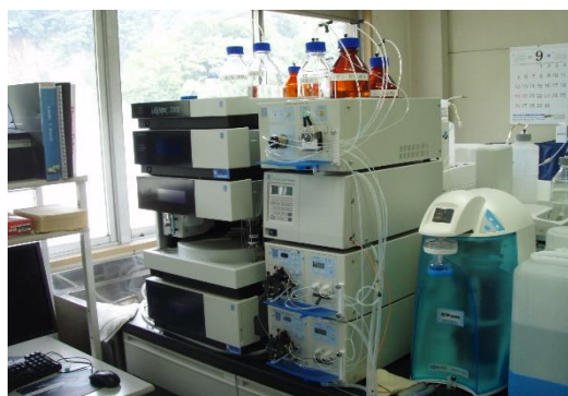
イオンクロマトグラフ(シアン)