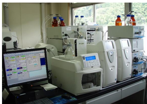
イオンクロマトグラフ(陰・陽イオン・臭素酸)