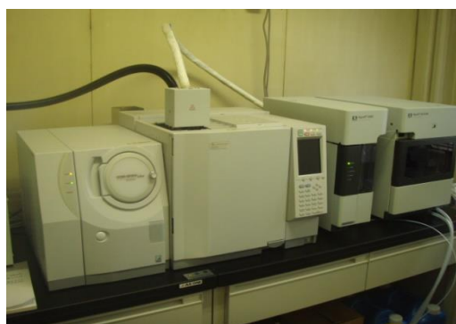
ガスクロマトグラフ質量分析装置